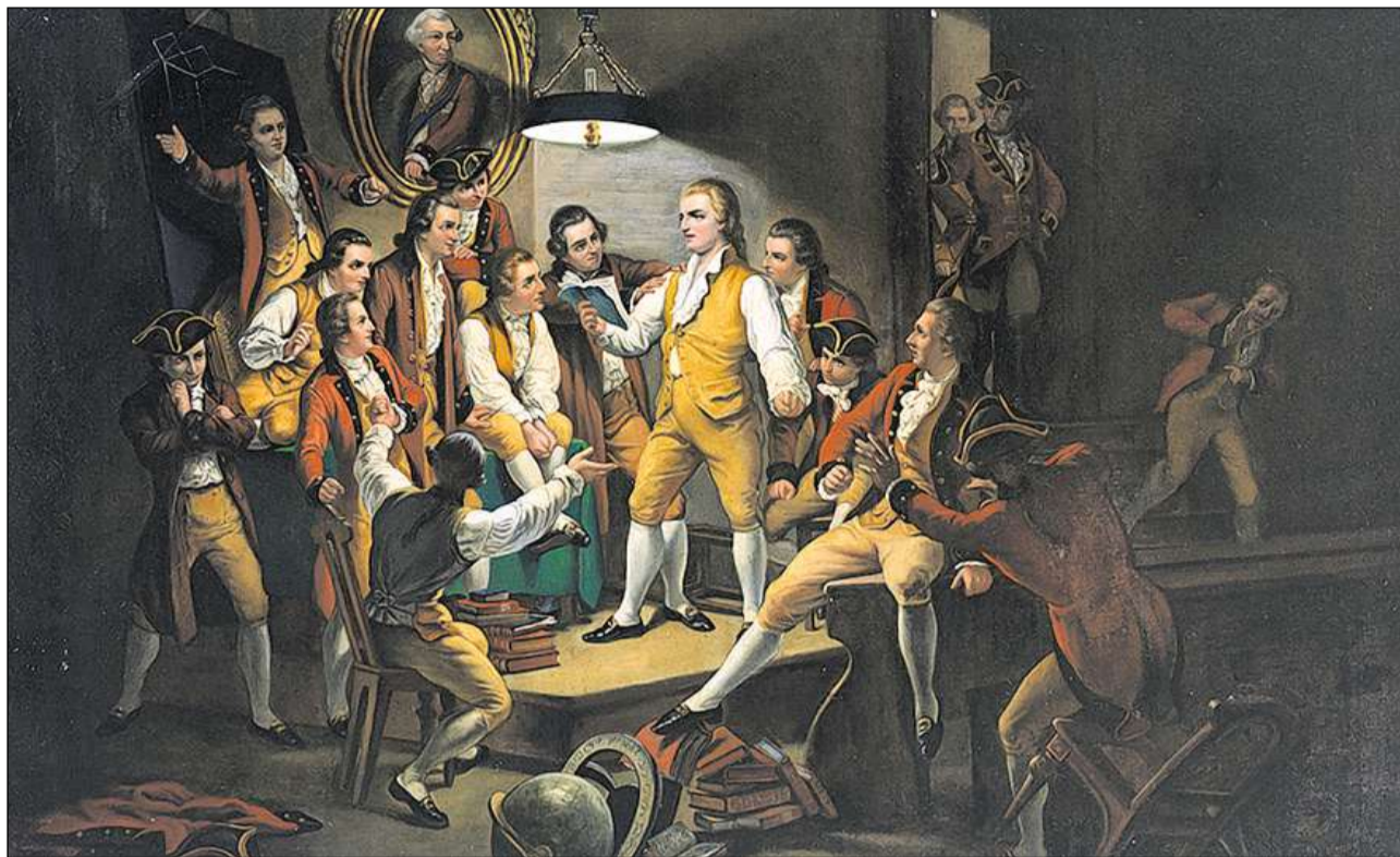
Schiller prelegia en il zuppà or da «Die Räuber», entant ch'ìls persecitaders dal duca arrivavan. (Maletg dal 19avel tschientaner).