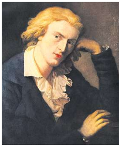
Purtret dal giuven Schiller (1786).