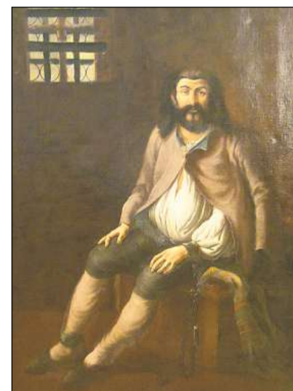
Hannikel empraschunà (ca. 1786/87).